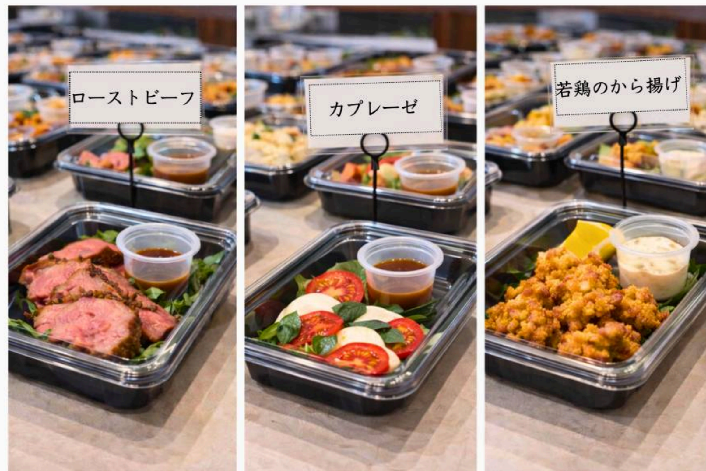
※画像はイメージとなります