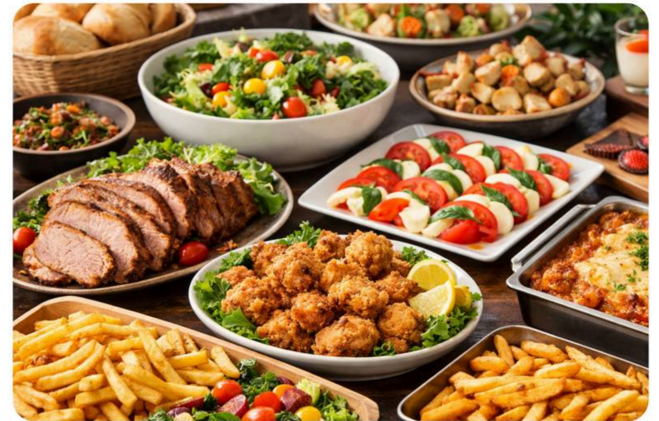
※画像はイメージとなります